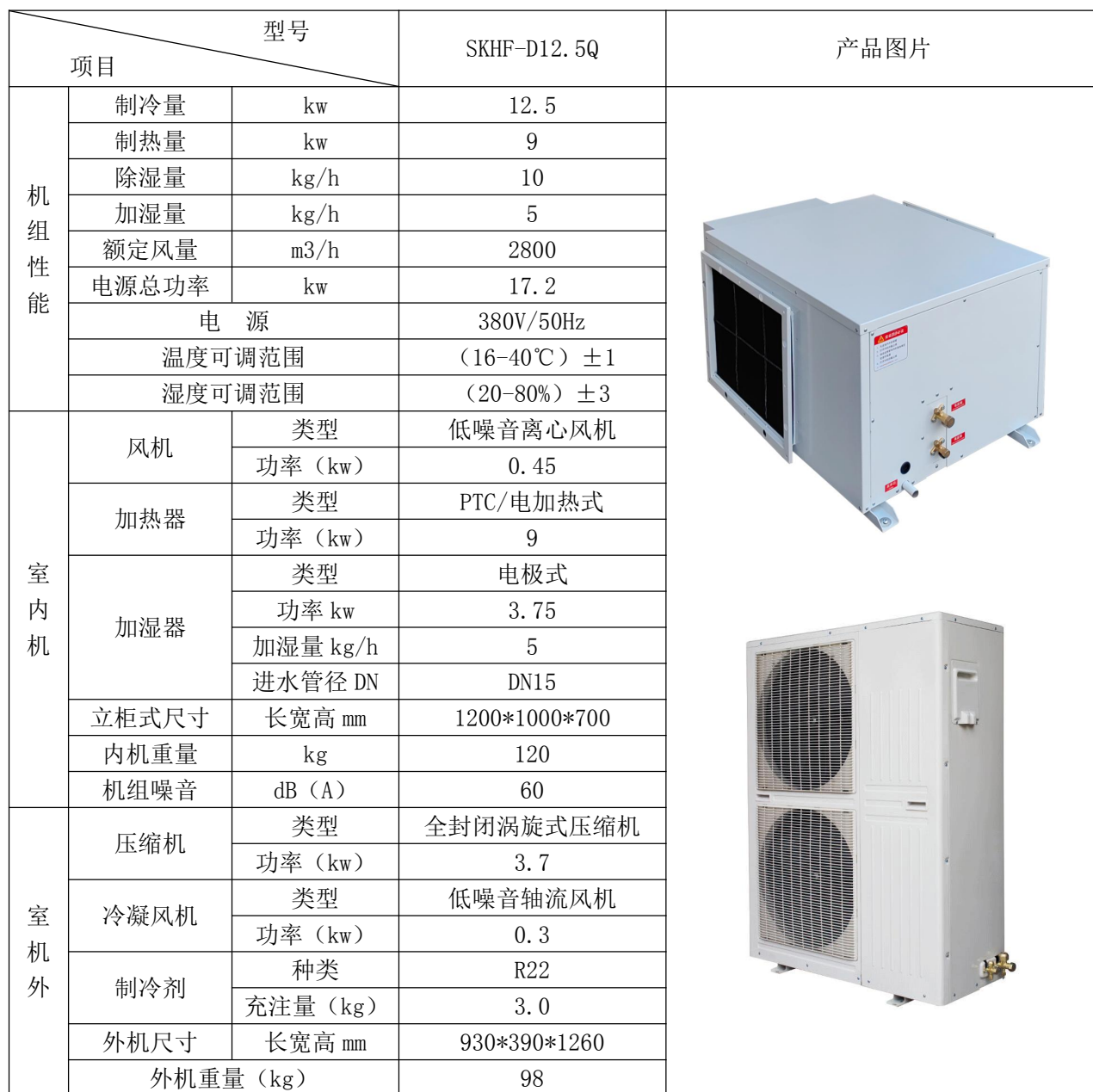
湿克吊顶式恒温恒湿机 SKHF-D12.5Q 参数表